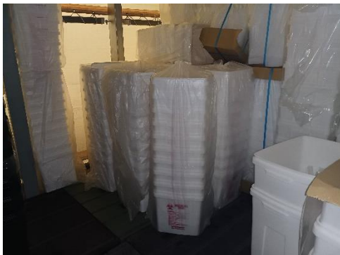
使用前容器の保管状況