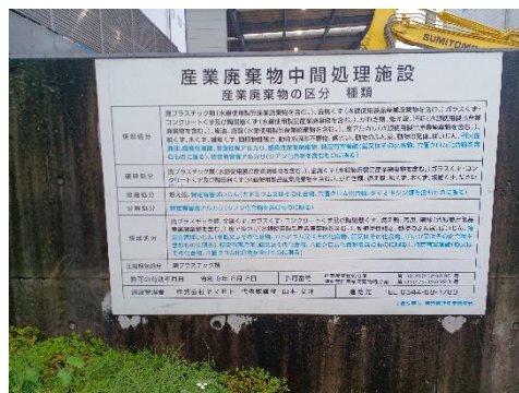
中間処理施設の表示