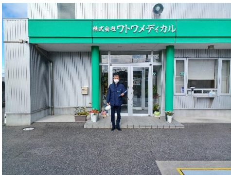
ワトワメディカル本社前