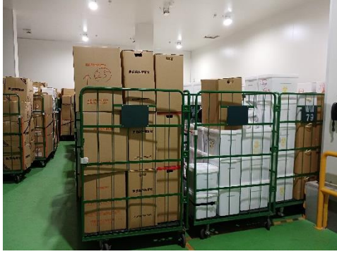
焼却前感染性廃棄物保管庫