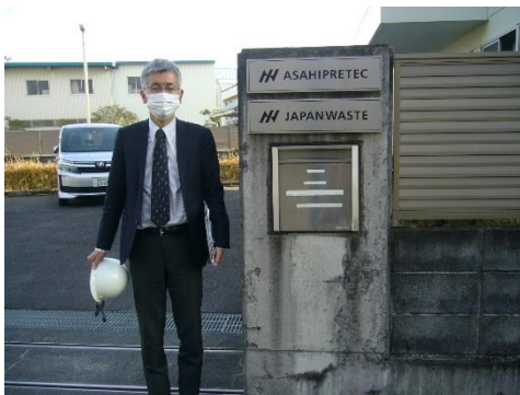
ジャパンウェイスト静岡営業課