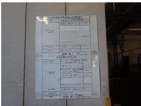
産廃処理施設の表示