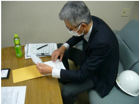
受渡確認票の確認