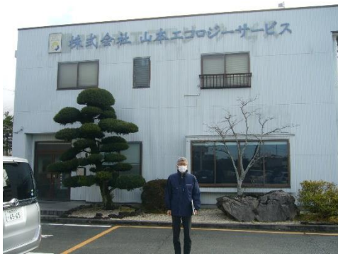
山本エコロジーサービス本社前