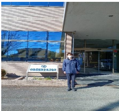
中遠環境保全本社前