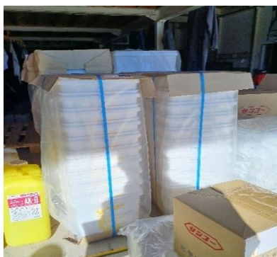
使用前容器の保管状況