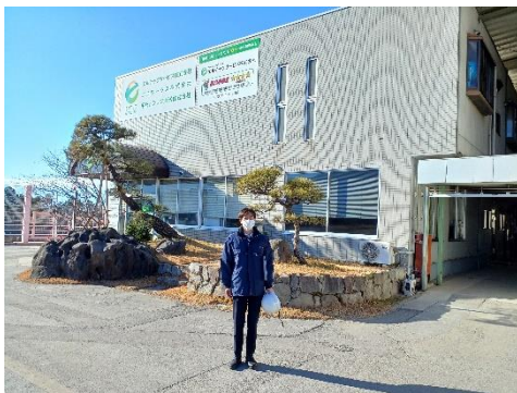
エルテックサービス本社前