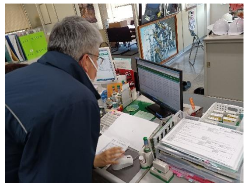
電子 manifests の確認