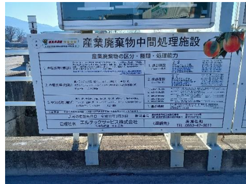
中間処理施設の表示