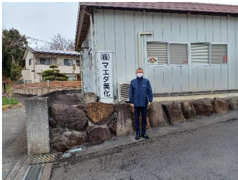
マエダ美化 営業所前