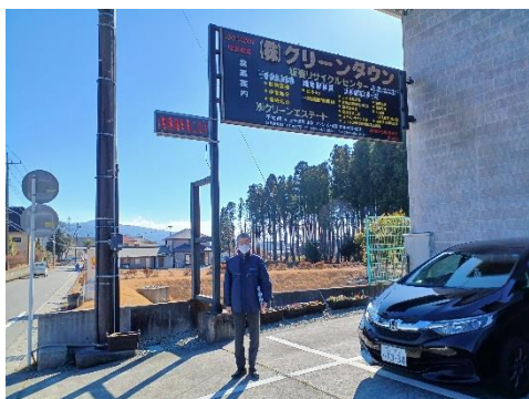
板妻リサイクルセンター前