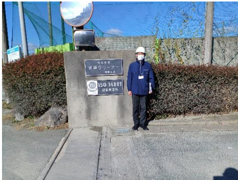
明輝クリーナー原町工場前