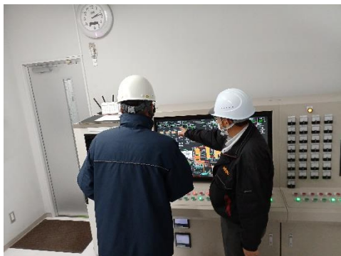
焼却炉のデータ確認