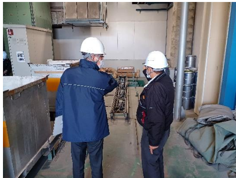
感染性廃棄物搬入口