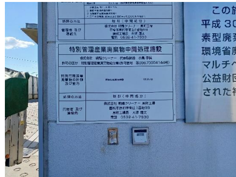
中間処理施設の表示