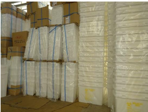
使用前容器の保管状況