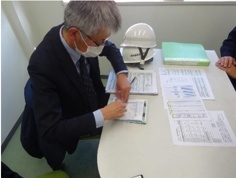
受渡確認票の確認