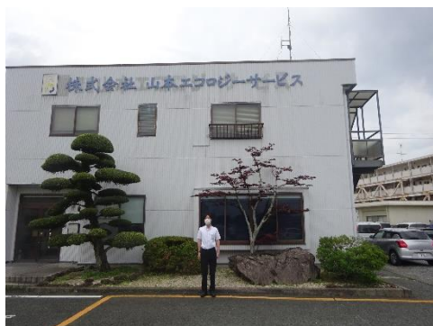
山本エコロジーサービス本社前