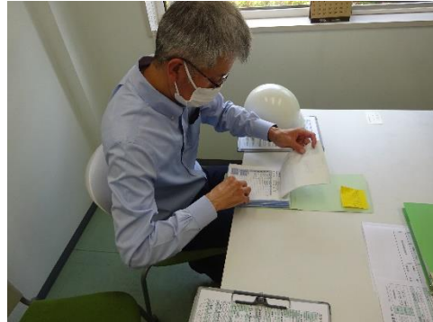
受渡確認表の確認