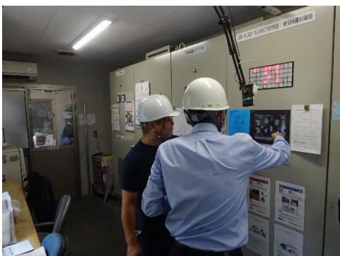
焼却炉のデータ確認