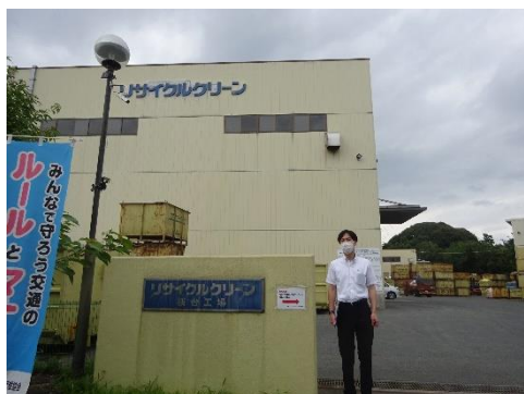
リサイクルクリーン桜台工場前