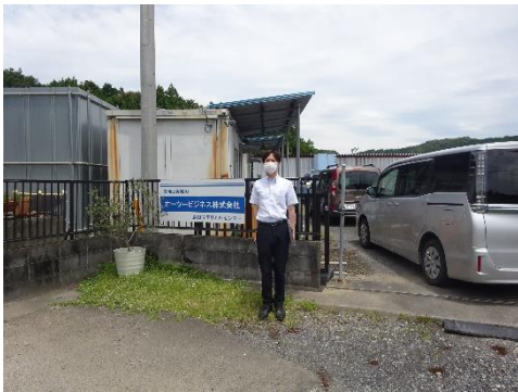
マテリアルセンター事務所前