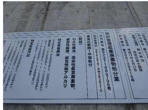
中間処理施設の表示