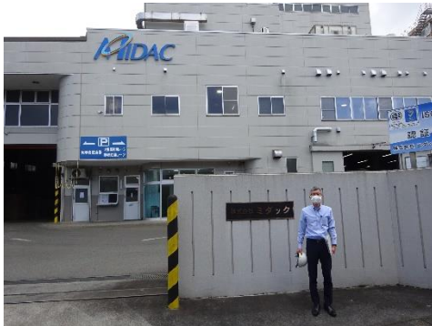
ミダック富士宮事業所前