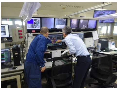
焼却炉のデータ確認