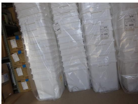
使用前容器の保管状況