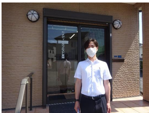
メディカルウエスト東海本社前