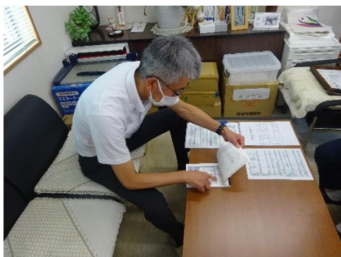
受渡確認票の確認