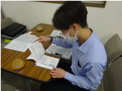
受渡確認票の確認