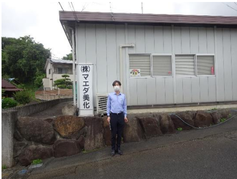
マエダ美化 営業所前