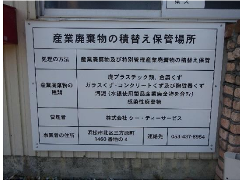
積替保管許可看板