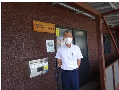
ケー・ティーサービス本社前