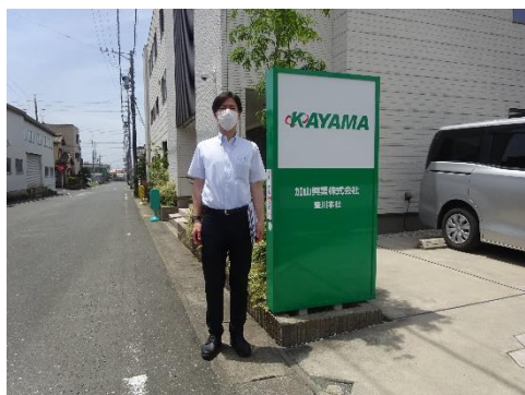
加山興業事務所前