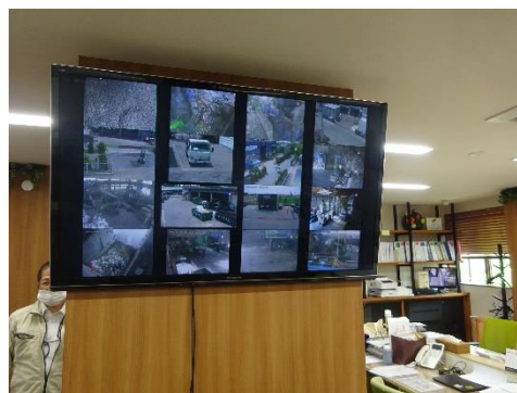
事務所内施設管理モニター