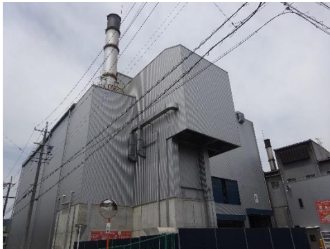
加山興業工場全体