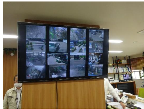
事務所内施設管理モニター