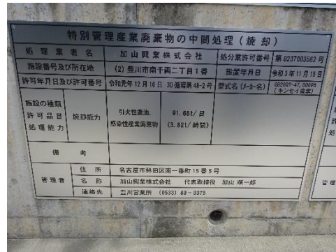
中間処理施設の表示