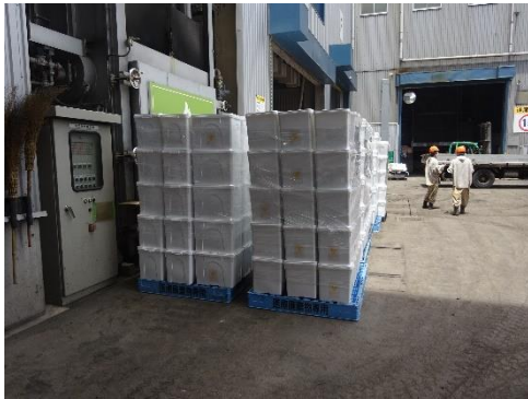
焼却前感染性廃棄物