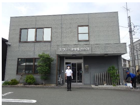
エスケード本社前