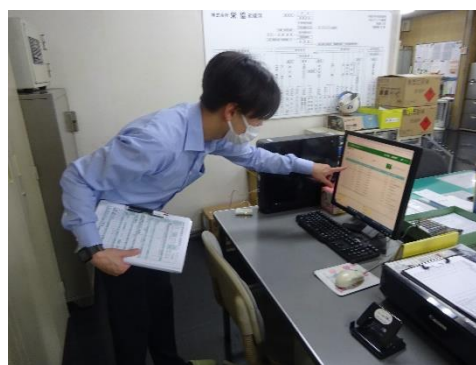
電子 manifests の確認