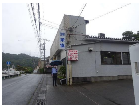
栄協 下田事業所前