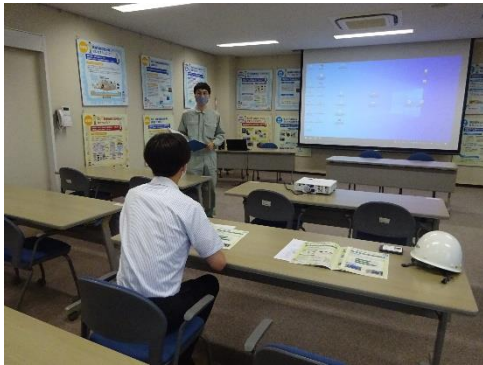
最終処分場の説明