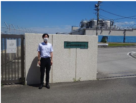
最終処分場事務所入口