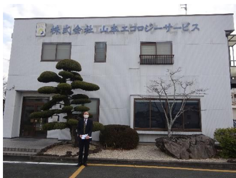
山本エコロジーサービス本社前