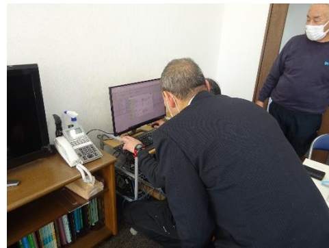
電子 manifests の確認