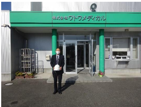
ワトワメディカル本社前