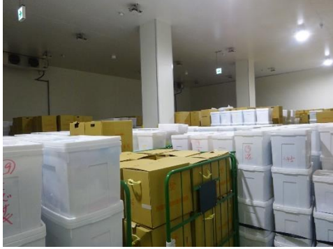
焼却前感染性廃棄物保管庫