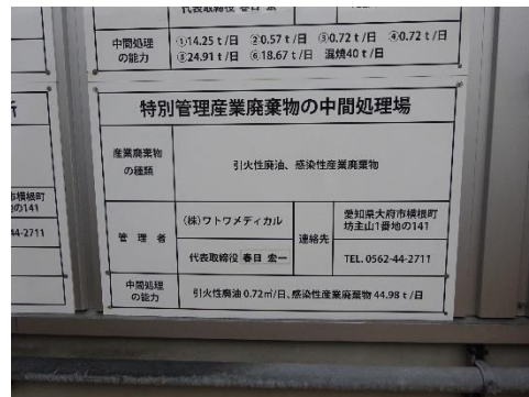
中間処理施設の表示