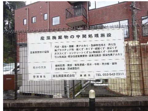
中間処理施設の表示