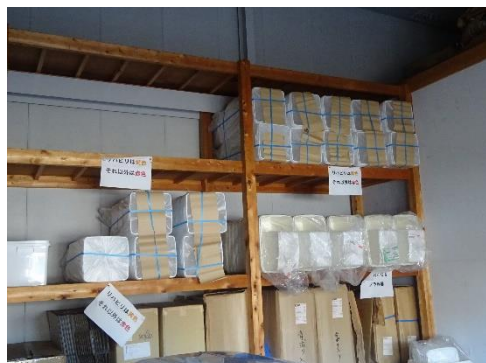
使用前容器の保管状況