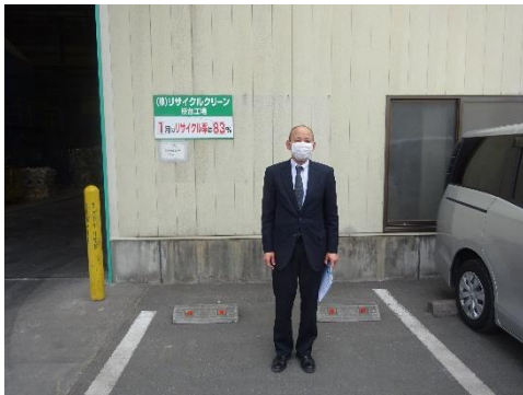
リサイクルクリーン桜台工場前