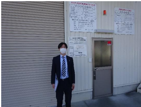
日本産業廃棄物処理本社前