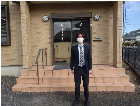
メディカルウエスト東海本社前