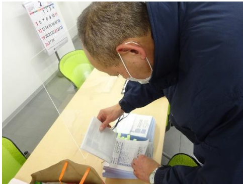
受渡確認票の確認