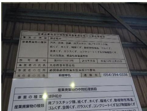
中間処理施設の表示