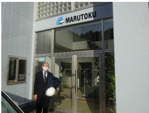
丸徳商事宍原事業所前