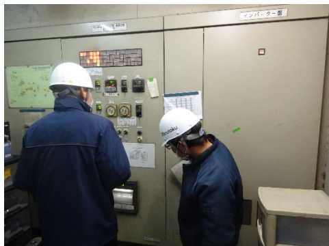
焼却炉のデータ確認