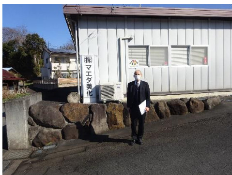
マエダ美化 営業所前