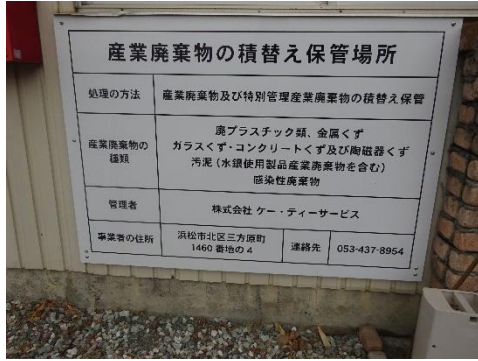
積替保管許可看板