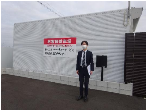
ケー・ティーサービス本社前