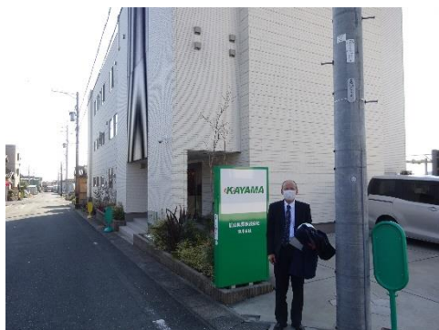
加山興業事務所前