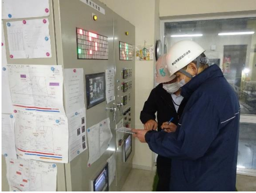
焼却炉のデータ確認