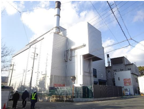
加山興業工場全体