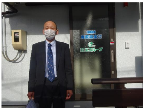
庵原興産松野事務所前