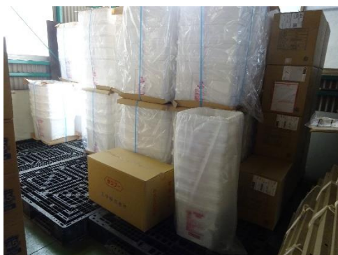
使用前容器の保管状況