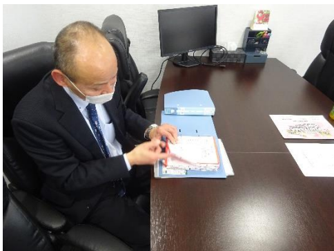
受渡確認票の確認