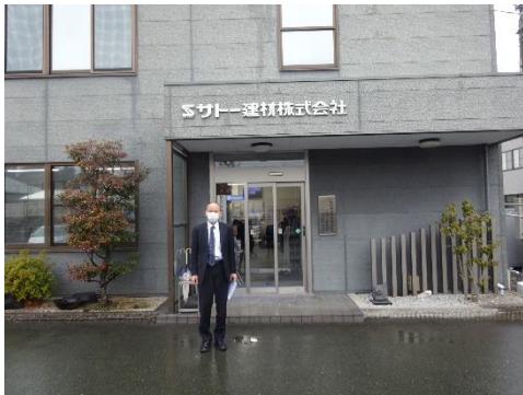
エスケード本社前