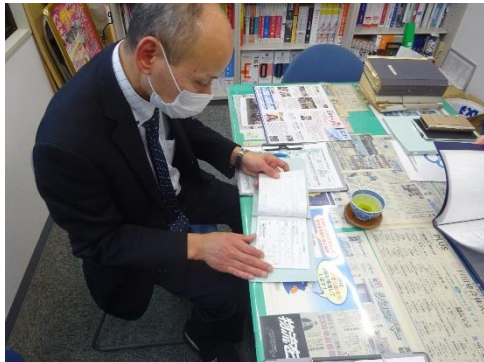
受渡確認票の確認