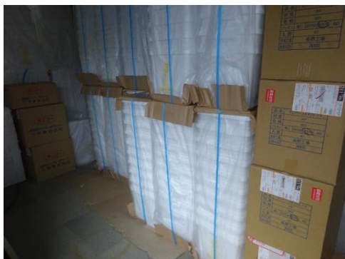
使用前容器の保管状況