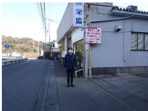
栄協 下田事業所前