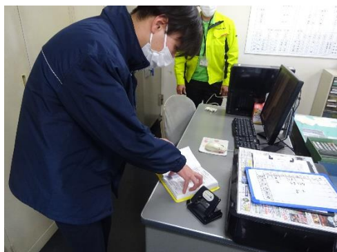
受渡確認票の確認