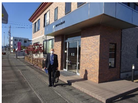
アスク長谷川本社前