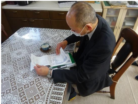
受渡確認票の確認