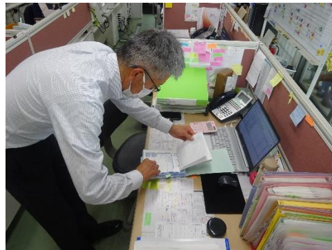
受渡確認表の確認