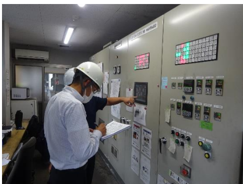
焼却炉のデータ確認