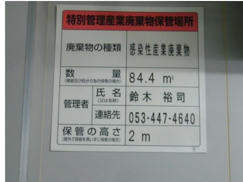
感染性廃棄物保管場所の表示