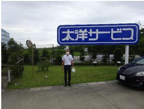
太洋サービス産廃処理工場