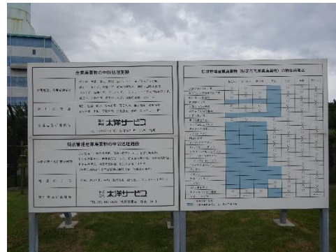
中間処理施設の表示