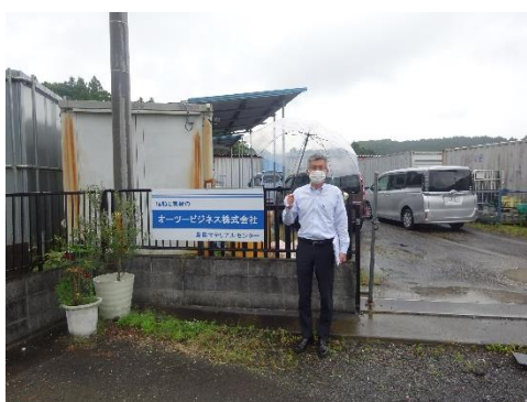
マテリアルセンター事務所前