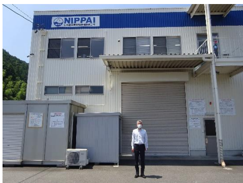
日本産業廃棄物処理本社前