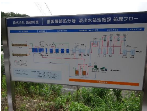
水処理施設説明の表示