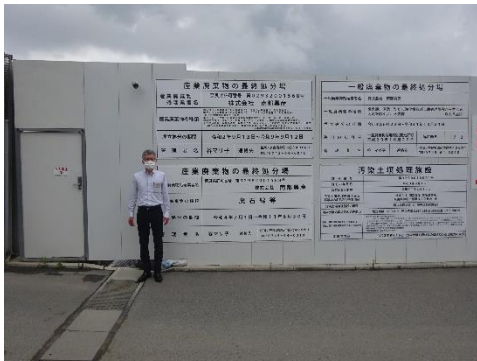
最終処分場の入口