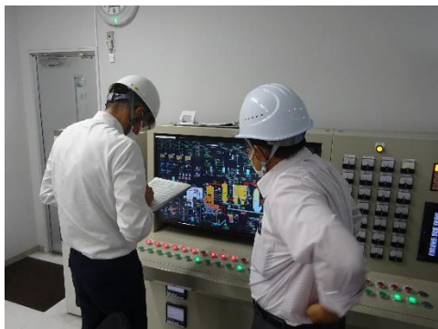
焼却炉のデータ確認