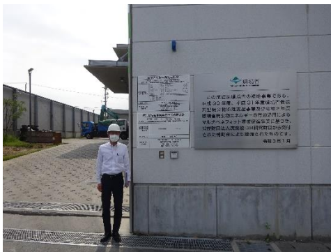
明輝クリーナー原町工場前