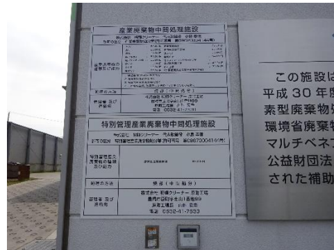
中間処理施設の表示