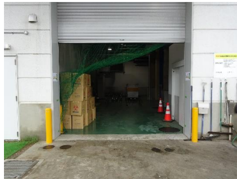
感染性廃棄物搬入口