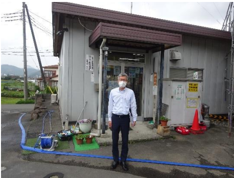
マエダ美化 営業所前