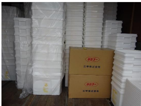
使用前容器の保管状況