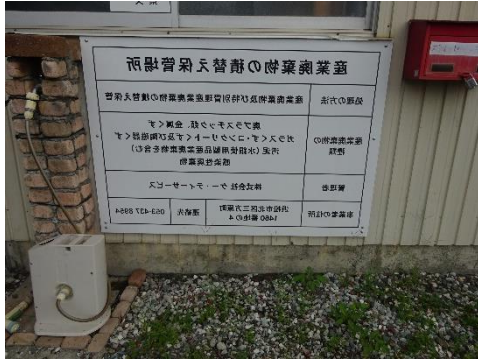
積替保管許可看板