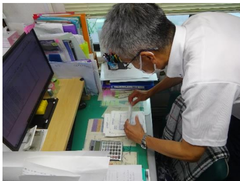
受渡確認票の確認