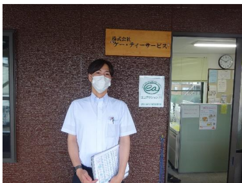
ケー・ティーサービス本社前