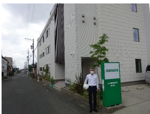
加山興業事務所前